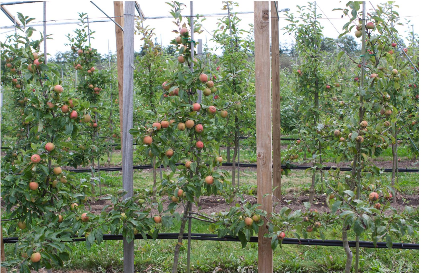
2. Tree under roof