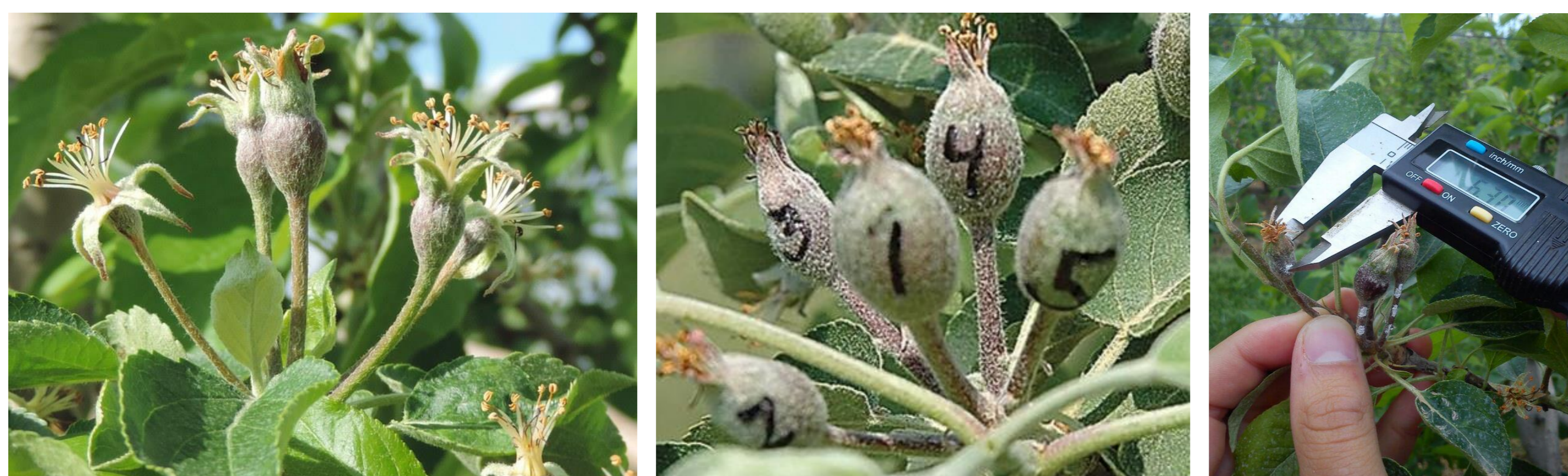
Quallat predit en pomeres 'Galaxy' tractades amb Brevis® a 2,2 kg/ha. La Tallada d'Empordà, 2017