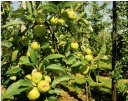
Foto 1. - Pigmeevruchtjes

6-BA bij appel = 1,5 l/ha Globaryll of 7,5 l/ha MaxCel of 7,5 l/ha Exilis