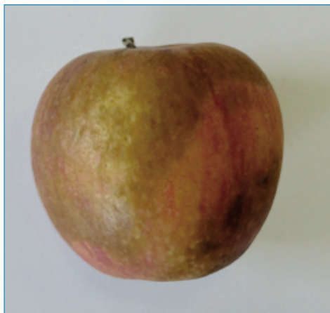
Fig. 1 Bruciatura su mela: 55^{\circ}\text{C} x 2'

mentre l'aggiunta di altre sostanze non ha prodotto miglioramenti sostanziali.