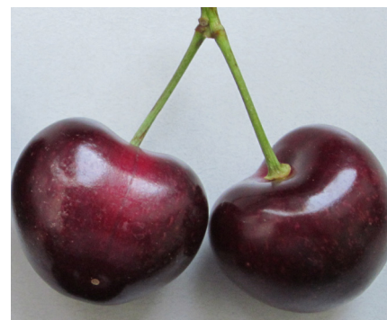
Kurze Stiele im sonst unauffälligen Erntejahr 2016.

Version: 01. 02. 2018 Herausgeber: Agroscope Redaktion: Simon Schweizer, Thomas Schwizer, Andreas Riedl, Agroscope Copyright: © 2018 Agroscope, Schloss 1, Postfach, 8820 Wädenswil Nachdruck mit Quellenangabe erwünscht. www.obstsorten.ch www.agroscope.ch